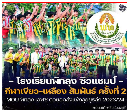
กิจกรรมรักกันแน่นเหนียว กลมเกลียวเขียวเหลือง