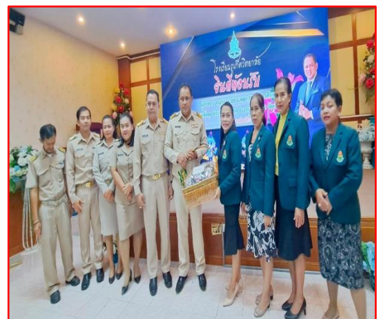
รับรางวัลเชิดชูเกียรติ