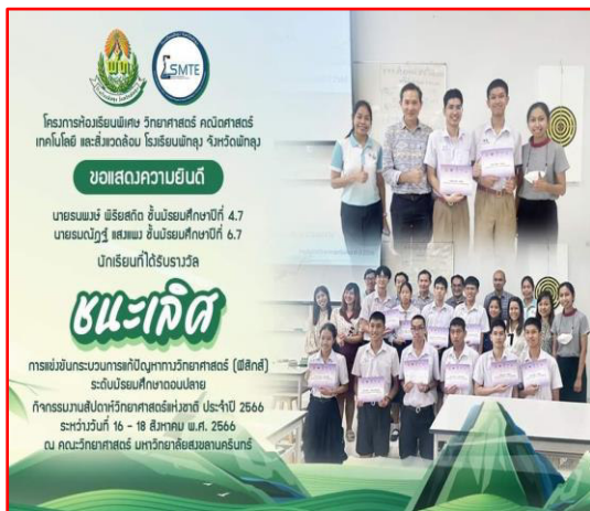
รับรางวัล เหรียญทองชนะเลิศ การแข่งขันกระบวนการแก้ปัญหาวิทยาศาสตร์ (ฟิสิกส์)