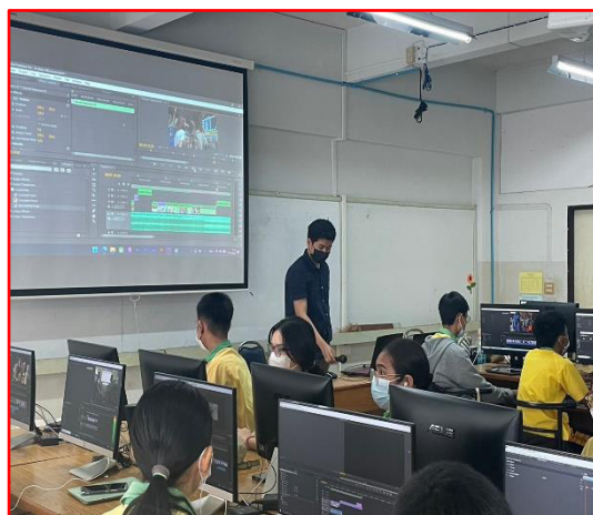
อบรมเชิงปฏิบัติการการตัดต่อวิดีโอแก่นักเรียน