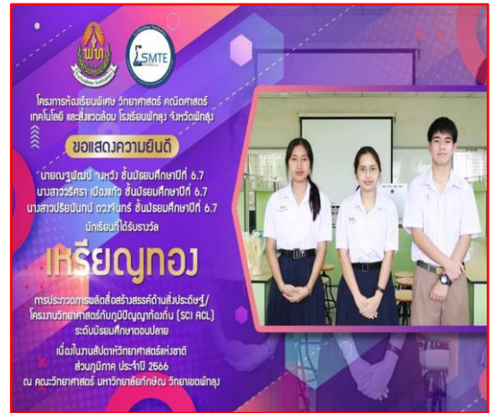
รับรางวัล เหรียญทอง การประกวดการผลิตสื่อสร้างสรรค์ด้านสิ่งประดิษฐ์