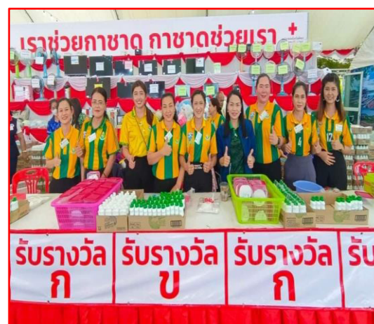
กิจกรรมงานกาชาด จ.พัทลุง