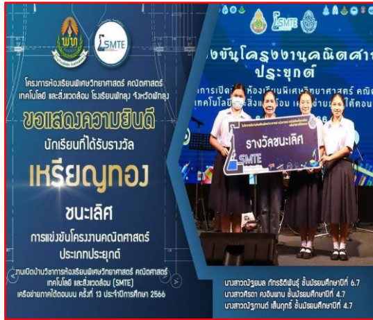
รับรางวัล เหรียญทองชนะเลิศ การแข่งขันโครงงานคณิตศาสตร์ประเภทประยุกต์

องค์ประกอบที่ ๓ Learning การจัดการเรียนการสอนที่เน้นผู้เรียนเป็นสำคัญ โรงเรียนมีการส่งเสริมให้ครูทุกคนวิเคราะห์หลักสูตร มาตรฐานการเรียนรู้ ออกแบบและจัดทำแผนการจัดการเรียนรู้ในชั้นเรียนแบบ Active Learning เน้นให้ผู้เรียนได้เรียนรู้ผ่านกระบวนการคิดและปฏิบัติจริง