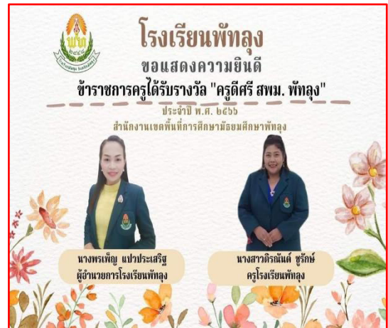
รับรางวัลเชิดชูเกียรติ