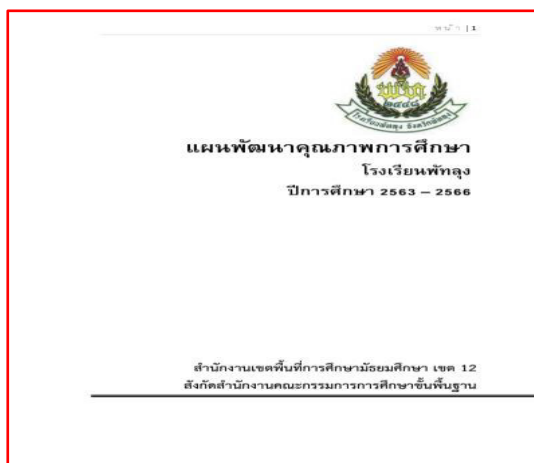
แผนพัฒนาคุณภาพการศึกษา