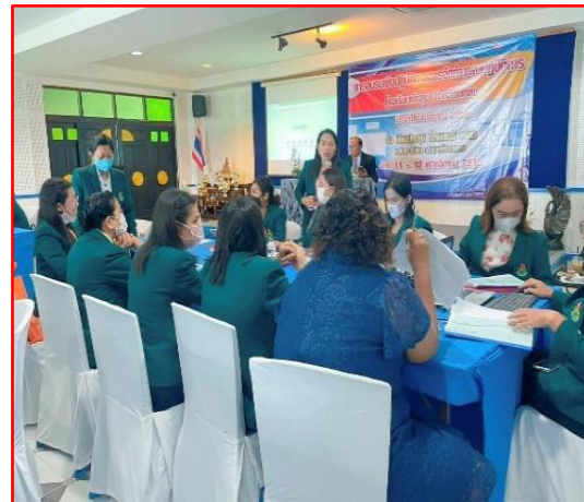
ประชุมเชิงปฏิบัติการการจัดทำแผนพัฒนาการศึกษา