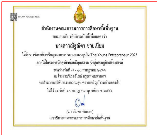
เกียรติบัตร เหรียญทอง การประกวดแผนธุรกิจ Th Young Entrepreneur ๒๐๒๓