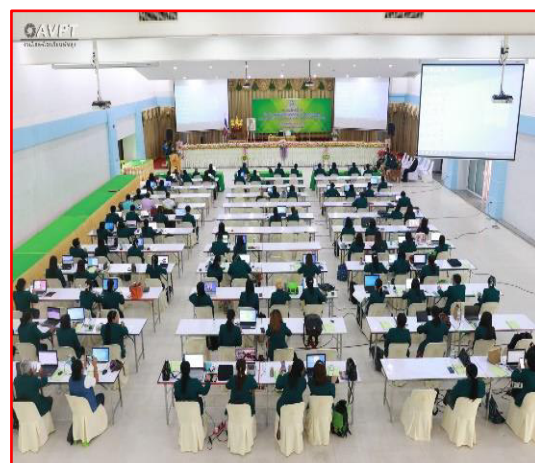
ประชุมข้าราชการครูและบุคลากรทางการศึกษา โรงเรียนพัทลุง