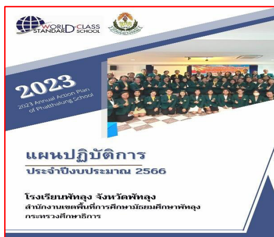
แผนปฏิบัติการประจำปี ๒๕๖๖