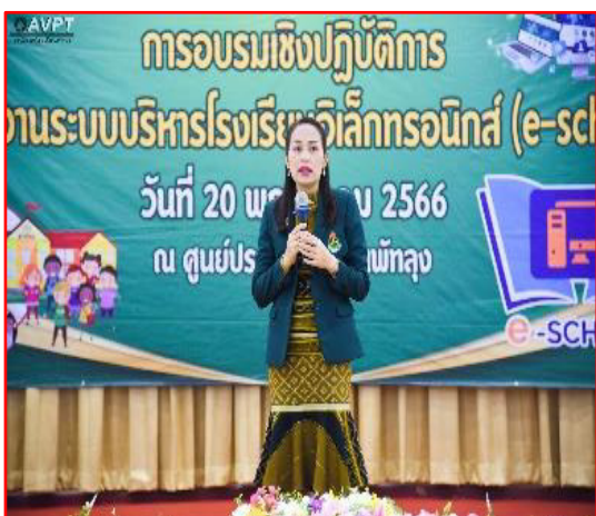
ประชุมเชิงปฏิบัติการการใช้โปรแกรม E-School

องค์ประกอบที่ ๒ Technology ส่งเสริมการอบรมเทคโนโลยี นวัตกรรมในการเรียนการสอน แก่ครูและนักเรียนเพื่อให้มีความสามารถในการใช้ ICT ให้มีประสิทธิภาพ