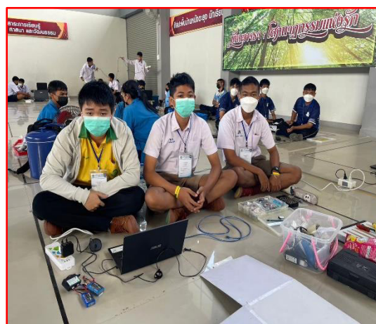
ส่งเสริมนักเรียนเข้าร่วมแข่งขันหุ่นยนต์ ในระดับต่างๆ