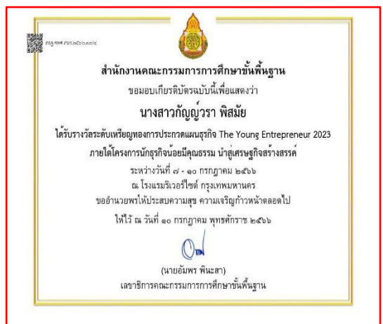
เกียรติบัตร เหรียญทอง การประกวดแผนธุรกิจ Th Young Entrepreneur ๒๐๒๓